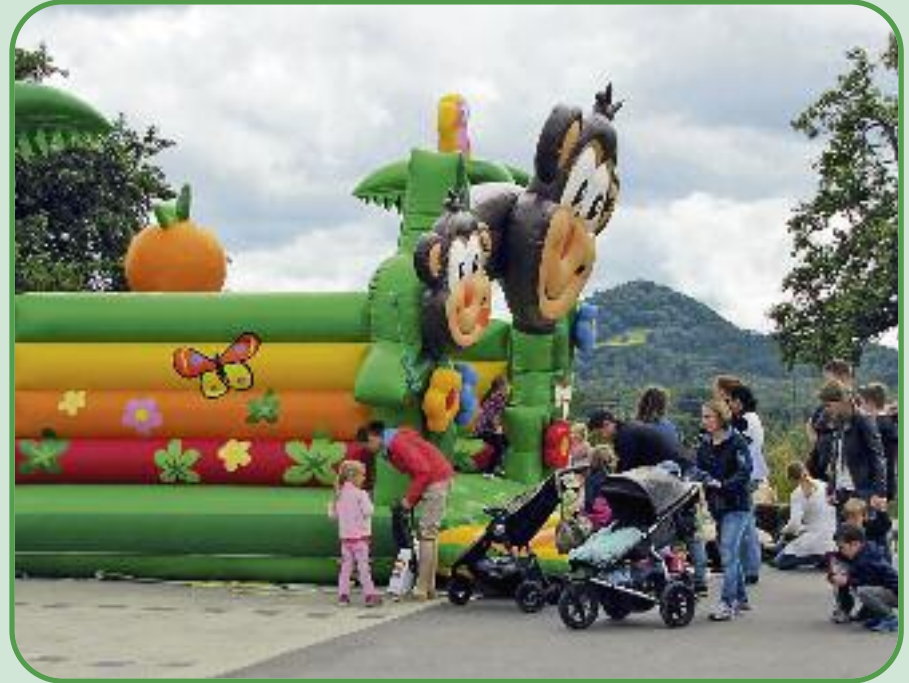
Riesen Spaß hatten die kleinen Besucher mit der „tierischen“ Hüpfburg, die von der Volksbank Reutlingen gesponsert wurde.