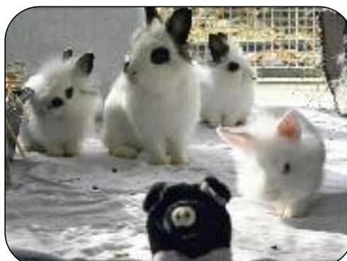
Esperanza mit Nachwuchs

Esperanza 1 Jahr und 3 Kinder (2x weiblich, 1x männlich), geboren 09/2015 Die Kaninchenfamilie hat im Tierheim ihr Glück gefunden. Wegen Zeit- und Platzmangel wurden die Tiere abgegeben. Mama Esperanza hat mit Liebe und Fürsorge ihre Kleinen aufgezogen. Mitte Dezember kann ihr Nachwuchs dann vermittelt werden. Noch brauchen die Kleinen ihre Mutter, damit ihr Sozialverhalten positiv bestärkt werden kann.