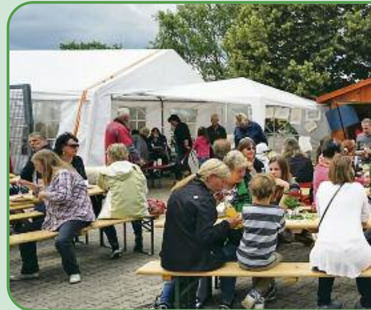
Gut besucht war das große Fest im Tierheim und den Bes