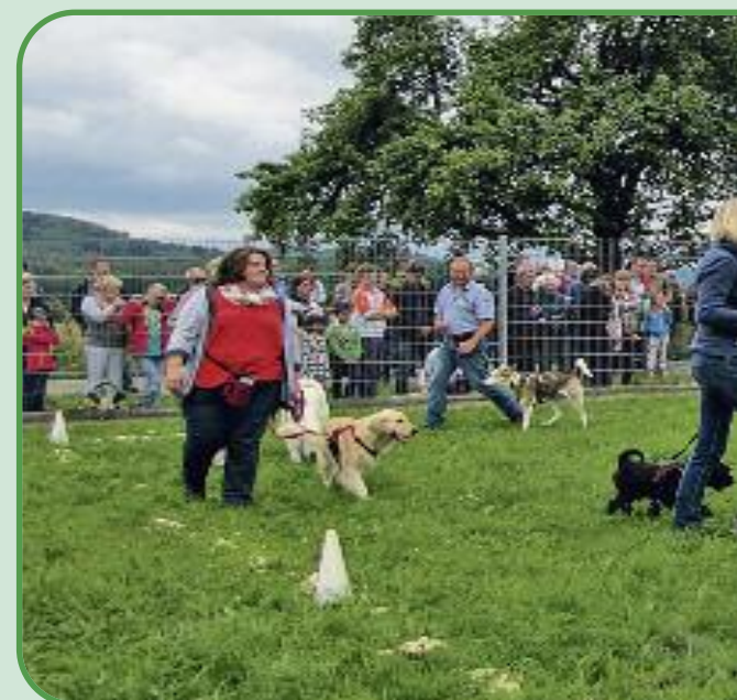
Die Hundeschule Training Mensch mit Hund von Su