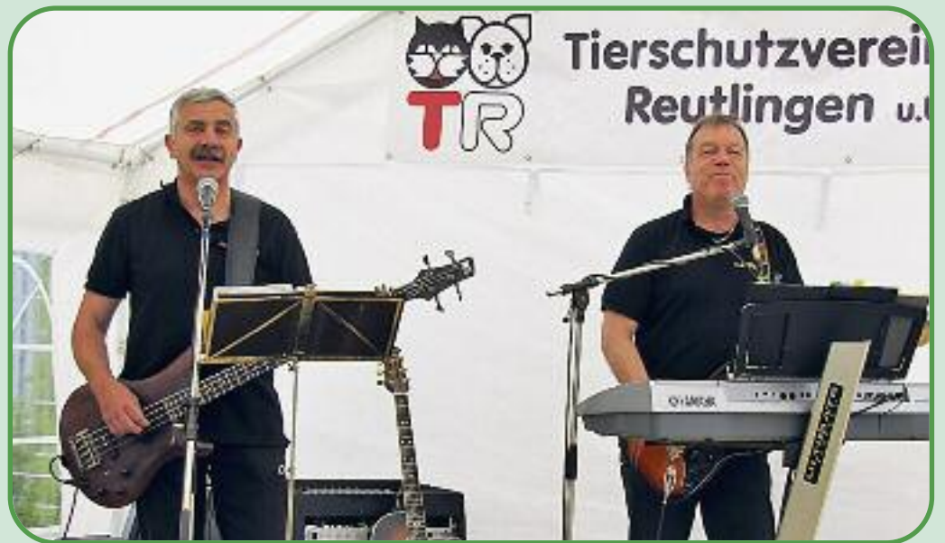
Für gute Stimmung sorgte das Duo Europa, das zugunsten des Tierheims auftrat und eigens aus Mengen angereist kam.