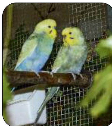
Jun Jun und Neflite

Hanni, 25 Jahre, Gelbwangenamazone Hanni musste aus gesundheitlichen Gründen ihrer Besitzerin abgegeben werden. Der Vogel wartet nun auf ein Zuhause bei einem Artgenossen in einer großen Voliere oder einem eigens für die Tiere angelegtem Vogelzimmer, wo sie mehrere Stunden am Tag ihren Freiflug nutzen können. Gelbwangenamazonen können bis zu 50 Jahre alt werden.