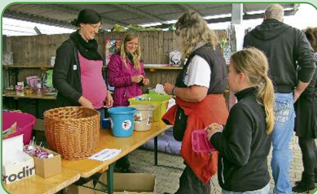
Die Tombola mit tollen Preisen war ein voller Erfolg.