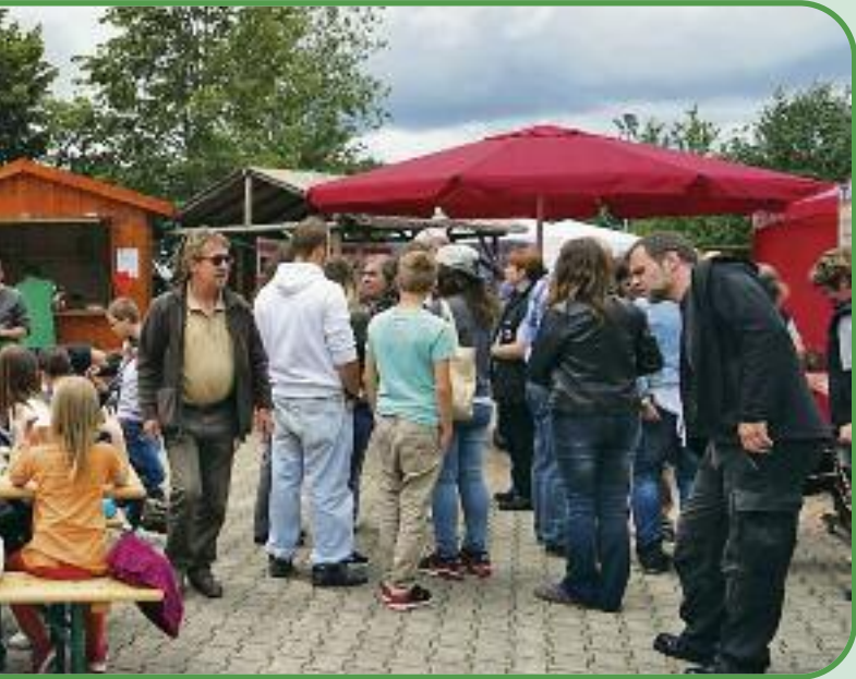
suchen bot sich einiges.