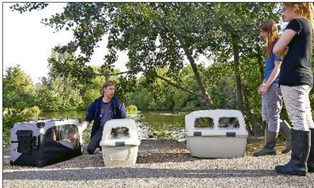
Die Schwanenfamilie nach dem gelungenen Einsatz.

Gemeinsam mit einem Nürtinger Schwanexperten konnte die umgezogene Schwanenfamilie wohlbehalten eingefangen und an ihren angestammten Platz am Markwasensee zurückgebracht werden.