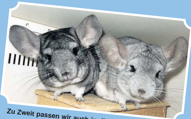
Zu Zweit passen wir auch in die kleinste Hütte.