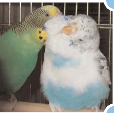
Komm unter mein Gefieder.