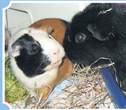
Wenn wir uns kriegen, haben wir Schw...