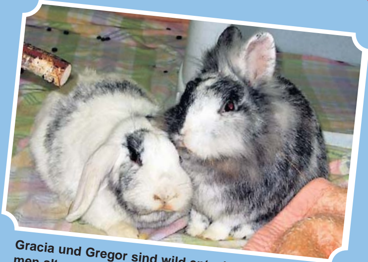
Gracia und Gregor sind wild entschlossen, zusammen alt zu werden.