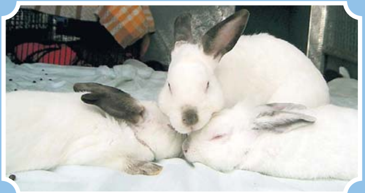
Eigentlich wollte ich Skat spielen.