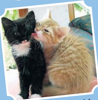
Wer mich liebt, putzt mich.