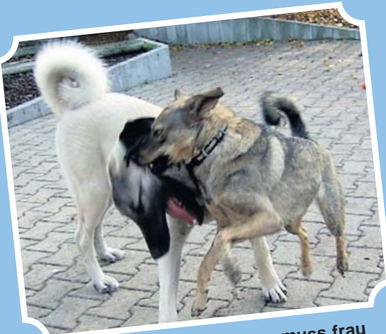
Bei schüchternen Männern muss frau die Initiative ergreifen.