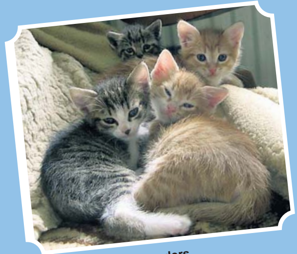
Wir können auch anders...