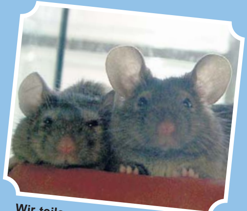
Wir teilen uns jeden Käse.