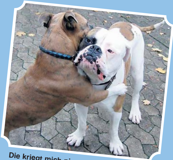
Die kriegt mich nie rum.