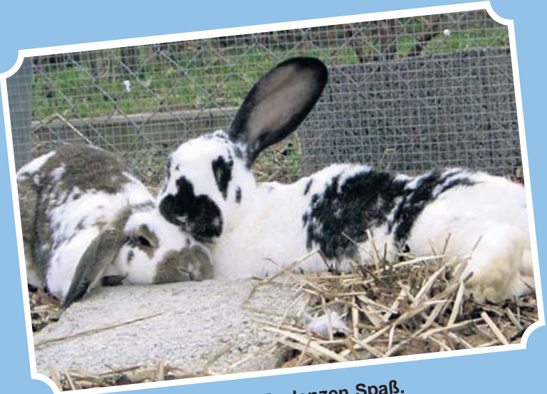
Zu Zweit macht sogar Faulenzen Spaß.