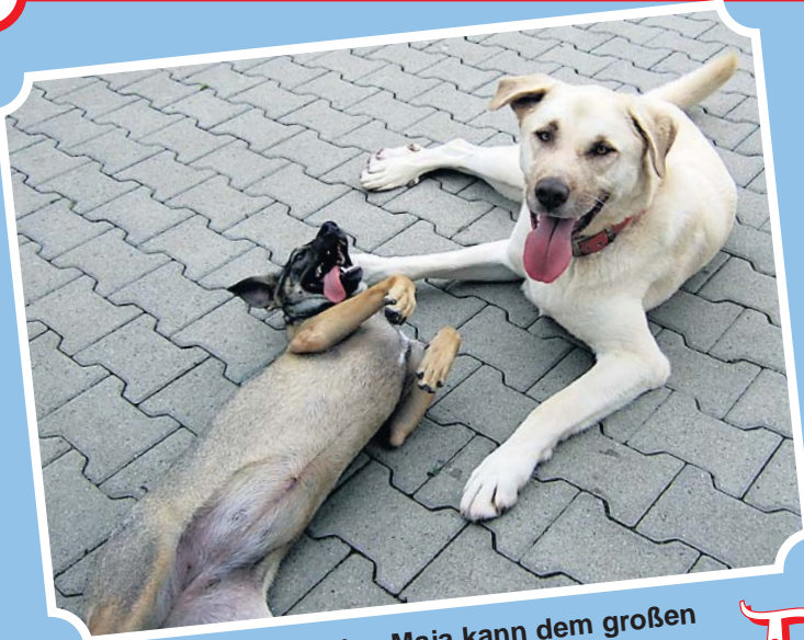
Wie im richtigen Film: Maja kann dem großen James Bond nicht widerstehen.