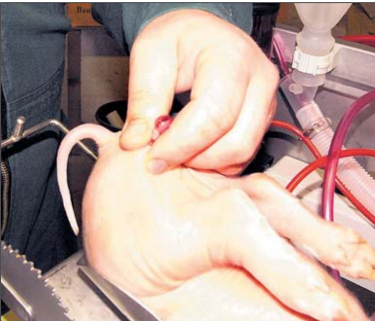
Da die Ferkel nach der Betäubung völlig entspannt liegen, erübrigt sich ein Bügel zum Fixieren.