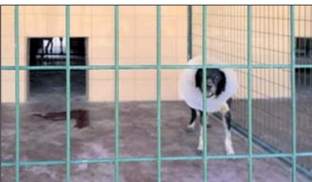
Städtische Tierheime - praktisch ausschließlich Übergangsweise für Hunde; einige Zeit nach der Kastration werden die Tiere wieder frei gelassen, wenn sich in der Zwischenzeit kein Halter oder Interessent gefunden hat.

Sanitär / Heizung / Flaschnerei / Apparatebau / Lasertechnik