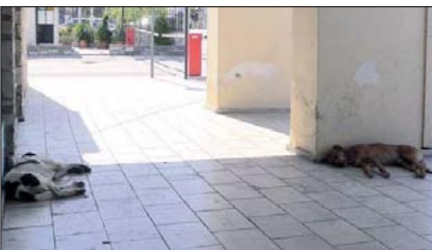
"Stray Dogs", streunende Hunde, ein alltäglicher Anblick überall im Stadtgebiet, oft in kleinen Rudeln, oft auf der Suche nach Wasser und Essbarem, im Sommer immer auch nach einem schattigen Fleck.

Tierschutz zuständigen Bürgermeister, Vertreter des örtlichen kleinen Tierschutzvereins sowie "private" aktive Tierschützer geladen waren. Auch der Oberbürgermeister der am Meer gelegenen Stadt empfing die deutsche Delegation und bekräftigte das städtische Interesse an den Erfahrungen, Tipps und aktiver Hilfe. Einigkeit bestand darin, dass der Transport dortiger Tiere ins nordwesteuropäische Ausland die Situation dort nicht lösen kann, dass vielmehr nachhaltige tierschutzgemäße Wege vor Ort gefunden werden müssen und das Verbringen der Tiere ins Ausland nur auf Notfälle beschränkt bleiben muss. Weitere Gespräche fanden mit einheimischen Tierschützern sowie mit engagierten Tierärzten vor Ort statt. Mit großem Interesse wurde die Einladung der deutschen Beteiligten an Mitarbeiterinnen und Mitarbeiter der dortigen Tierheime zu einem Besuch in einem baden-württembergischen Tierheim aufgenommen, mit der Möglichkeit von Gegenbesuchen, um Erfahrungen direkt austauschen zu können und voneinander zu lernen. Der erste Besuch in Reutlingen ist inzwischen in der Planung. Von großem Interesse waren vor Ort auch Erfahrungen im Tierheimbau sowie verschiedene Gesetzesgrundlagen für das tierschützerische Wirken.