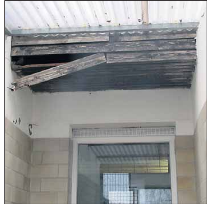
„Holzbalken an der Decke lösen sich.“

Über 40 Jahre steht das Tierheim im Gewand Stettert nahe Sondelfingen nun schon. In dieser Zeit wurden nicht nur unzählige Tiere aufgenommen und wieder vermittelt, auch etliche Umbau- und Renovierungsmaßnahmen waren von Nöten, um die Substanz der Häuser und Anlagen zu erhalten und die Sicherheit für Mensch und Tier zu gewährleisten.