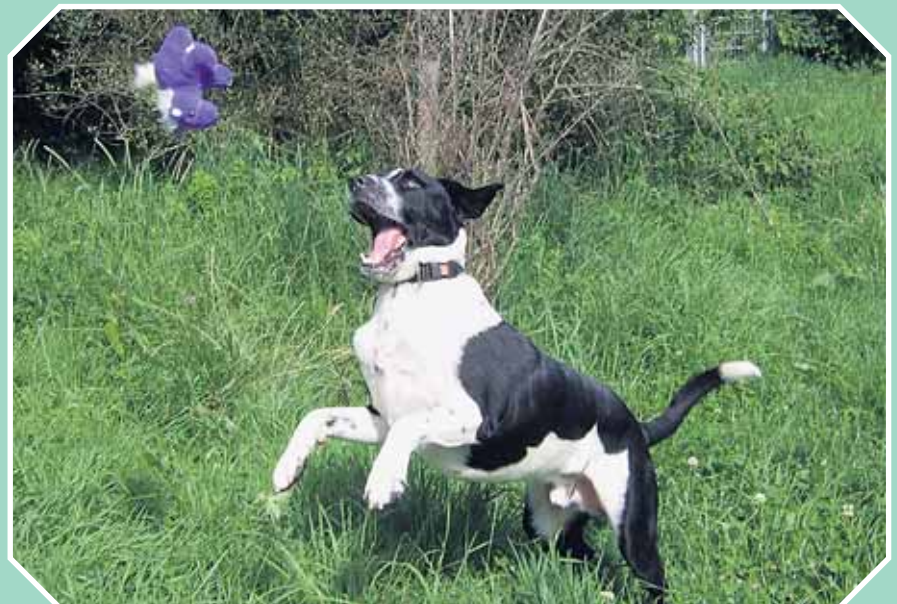
Ich krieg ihn, ich krieg ihn