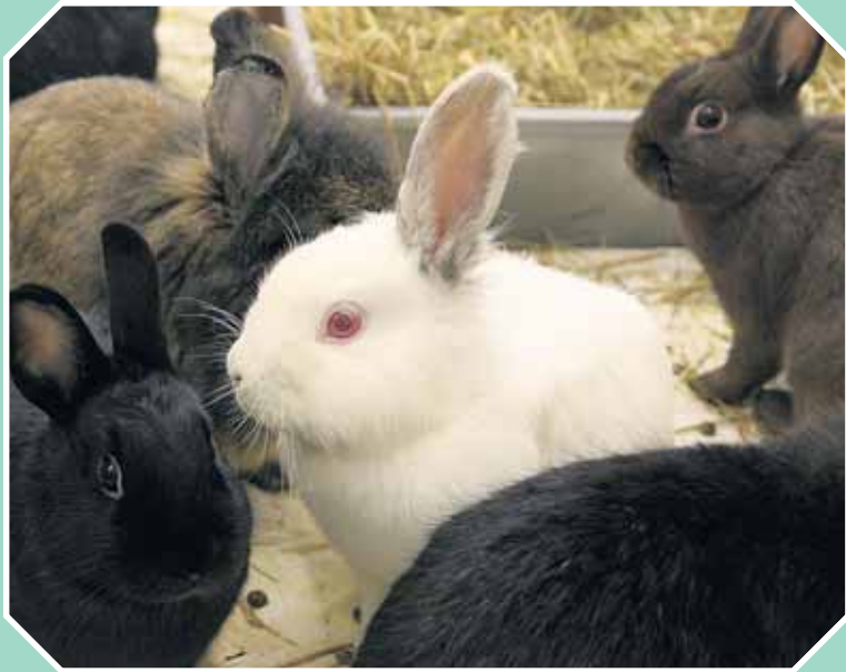
Was soll das heißen ich geh nicht als Osterhase durch?