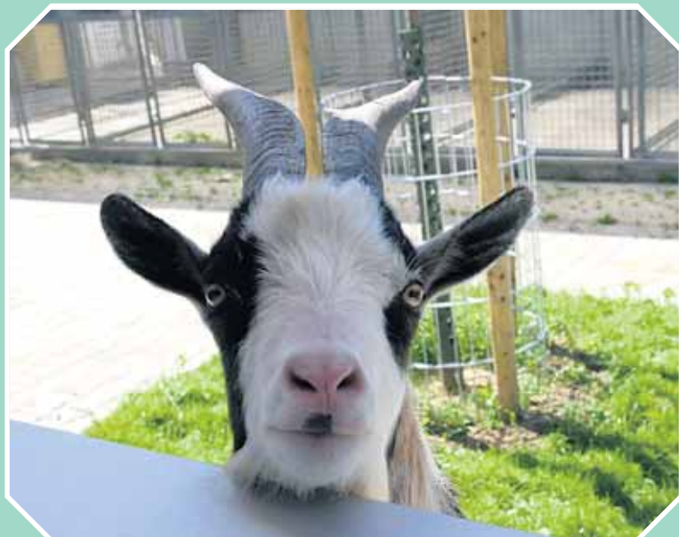
Macht bloß keinen Quatsch bei der Vermittlung - ich bin kein Berner-Sennen-Bock!