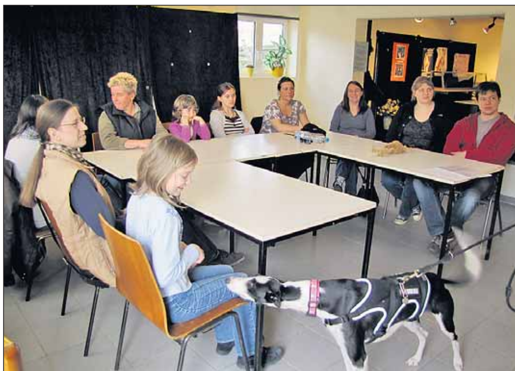
Kursteilnehmer bei der Theorie

vor dem 16. Geburtstag stehen, um dann gleich mit Gassigehen beginnen zu können.