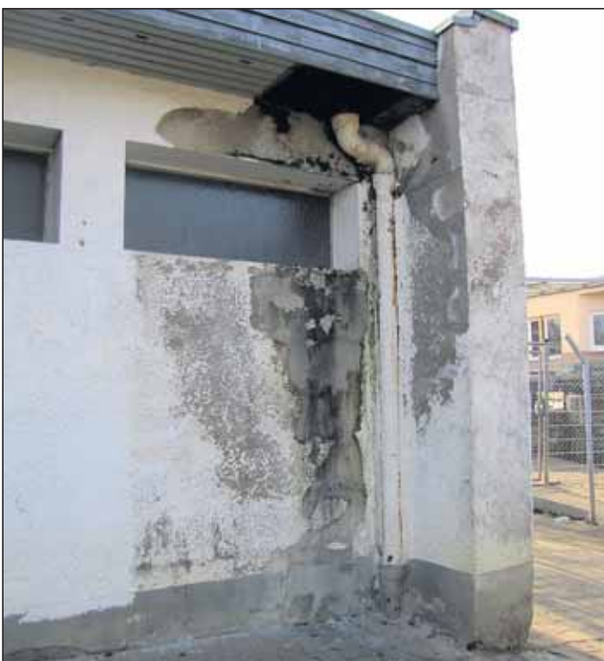
„Schimmelbildung an den Wänden.“

Herzlichen dank im Voraus für Ihre Unterstützung