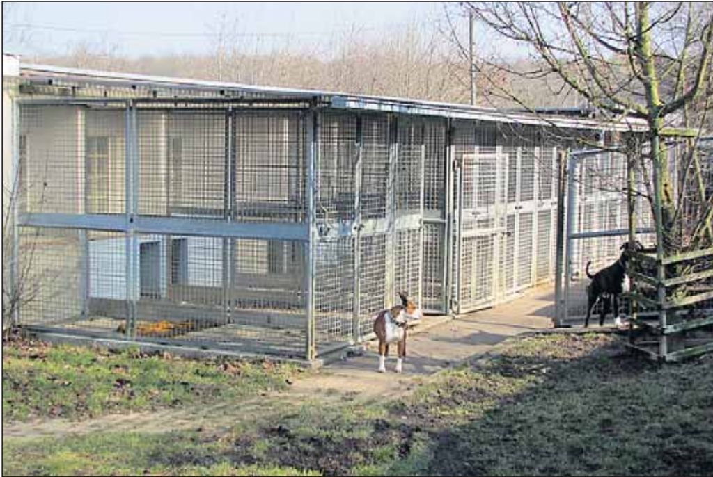
„Eines der betroffenen Hundehäuser.“