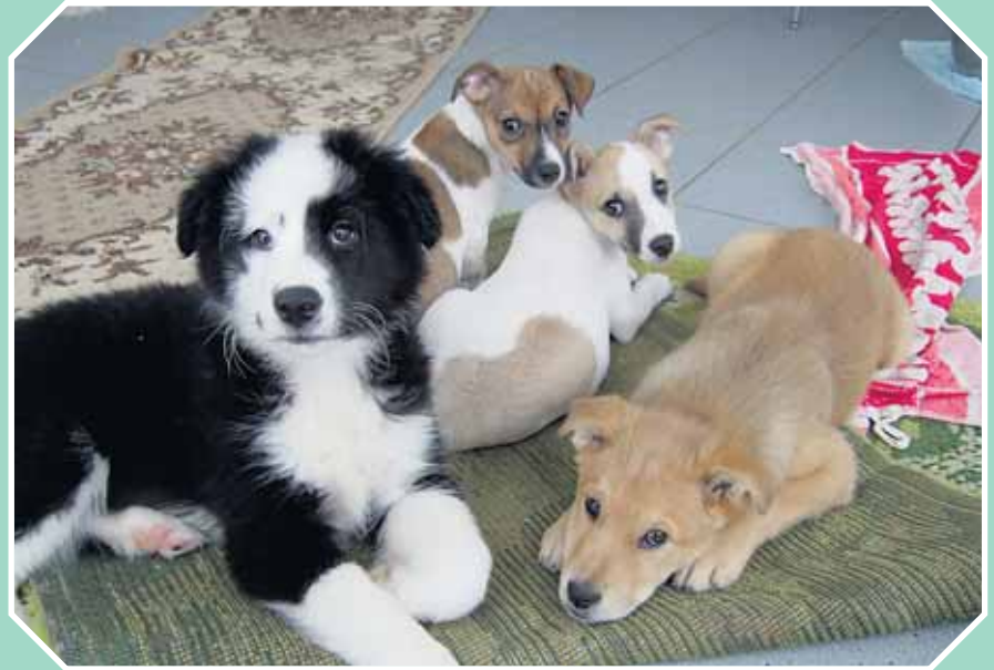
Schaut mal Jungs, die neue Kindergärtnerin!