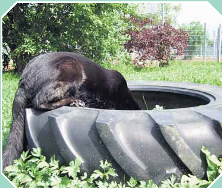
Wo haben die Pflegerinnen nur mein Osternest versteckt?