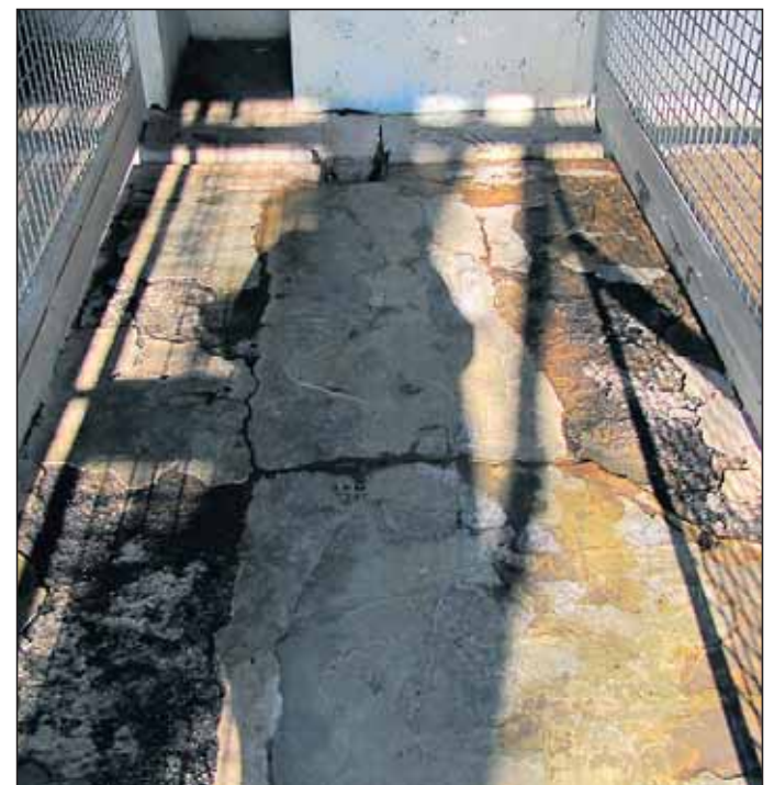
„Kaputte und aufgerissene Böden, in denen kein Hund mehr untergebracht werden kann.“

Wir hoffen sehr, auch die Baumaßnahmen an den Hundehäusern finanziell gut bewältigen zu können. Deshalb möchten wir Sie,