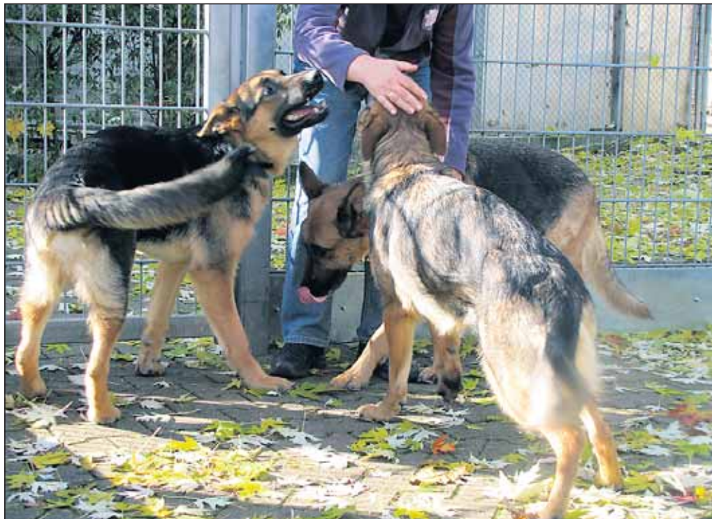
Voller Freude genießen die Hunde am nächsten Tag ihre Freiheit

Katastrophale Zustände bot sich dem dortigen Amtstierarzt. Die Schäferhunde lebten in einem ehemaligen Stall und wurden in verschiedenen Zwingern gehalten. Sie fristeten ihr Dasein dort fast im Dunkeln. Ausläufe hatten die Hunde keine. Bereits vor längerer Zeit wurde den Besitzern Auflagen für eine tiergerechte Haltung gemacht. Nachdem dies jedoch keine Wirkung zeigte, beschlagnahmte nun das Veterinäramt die Tiere. Zuvor mussten aber erst Unterbringungsplätze für die acht Schäferhunde gefunden werden, denn sonst wäre dies nicht möglich gewesen. Das zuständige Tierheim Sigmaringen