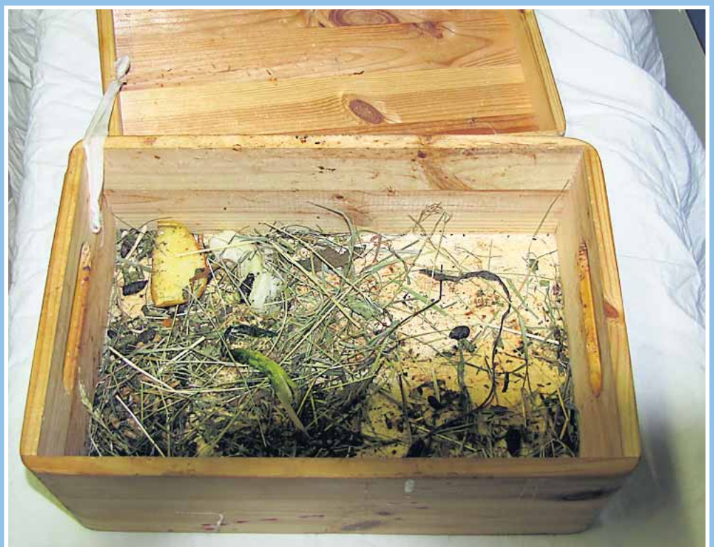
In dieser Holzkiste wurden die Ratten ausgesetzt.

Glück im Unglück hatten zwei Ratten an einem kalten Winternachmittag, als sie von einer Spaziergängerin entdeckt wurden, die gerade mit ihrem Hund Gassi ging. Die Spaziergängerin staunte nicht schlecht, als sie eine Ratte am Weg sitzen sah. Diese schien sehr zahm zu sein, sie rührte sich nicht von der Stelle und ließ sich von der Finderin problemlos anfassen. Beherzt nahm sie das Tier mit nach Hause und fragte eine Tierheimmitarbeiterin, was sie tun sollte. Da solche Tiere meistens in Gruppen gehalten werden bat sie die Finderin, nochmals an den Fundort zurückzugehen um nachzuschauen, ob evtl. noch ein weiteres Tier dort zu finden ist. Tatsächlich fand die Frau eine zweite Ratte unter dem Laub sitzen. Dort suchte das Tier vermutlich Schutz vor Kälte und Nässe. Neben der Ratte lag eine Holzkiste, in der die Tiere ausgesetzt wurden. Zum Glück konnten die beiden Nager gerettet und unversehrt ins Tierheim gebracht werden. Dort wurden sie erstmal versorgt. Inzwischen haben die beiden ein neues Zuhause gefunden.