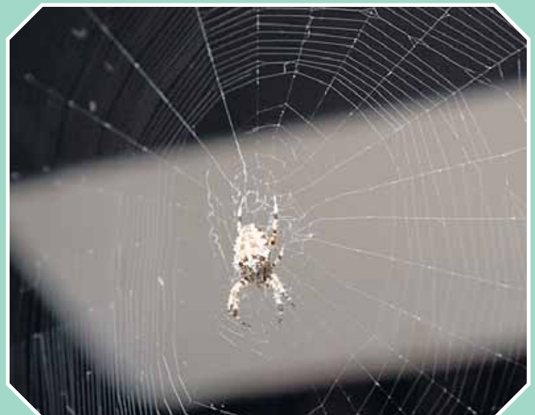
Tierheim mag ich. Da kann man auch mal hängen bleiben.