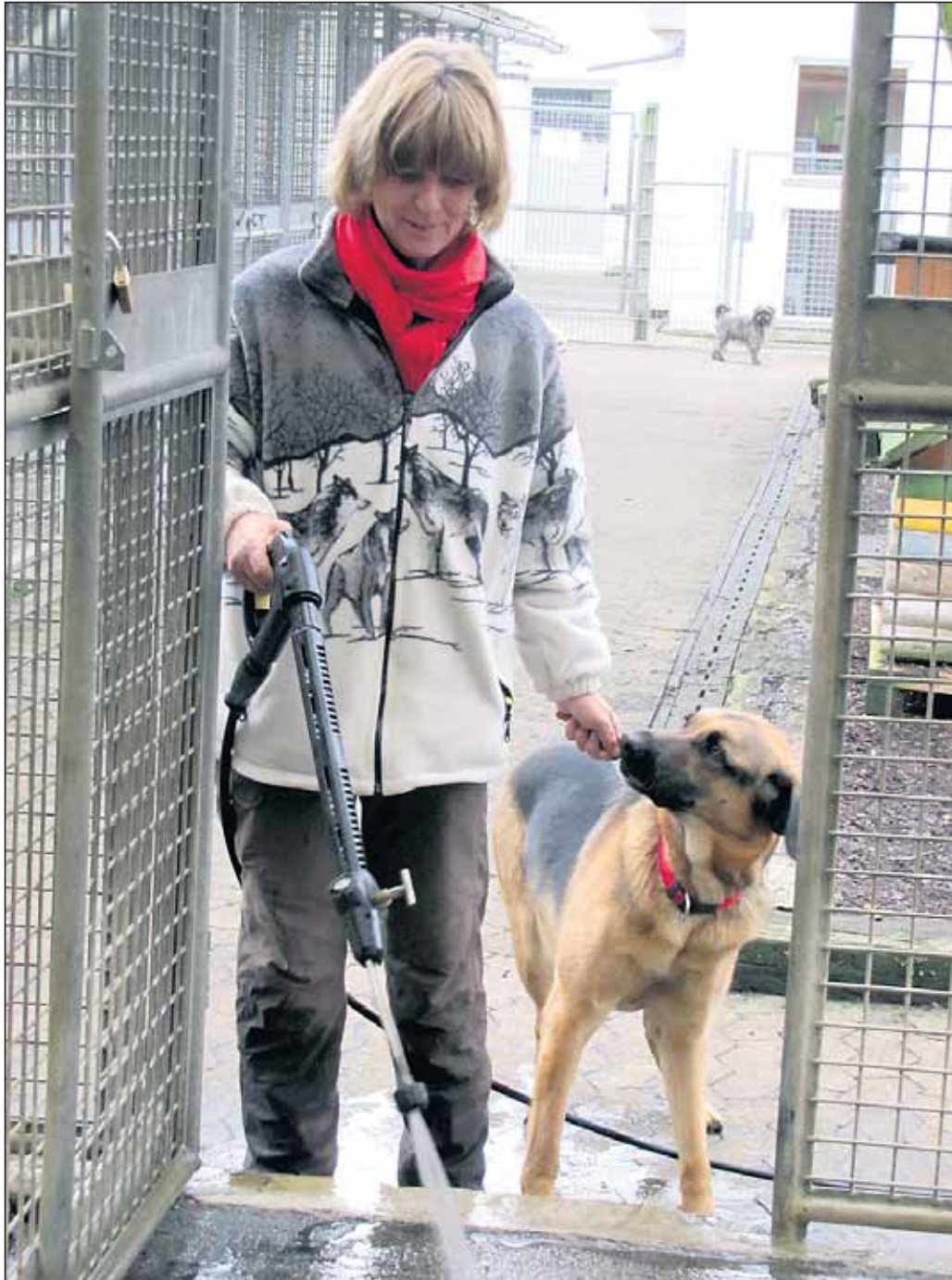
„Das Ausspritzen der Zwinger mit dem Dampfstrahler.“

Dafür sind leere Zwinger nötig, zuerst außen, dann innen. Das ist eigentlich kein Problem, denn die Hunde kennen den Tagesablauf gut. Vielen öffne ich die Klappe und bitte höflich, schon sind sie auf der anderen Zwiingerseite. Es gibt aber auch die Schätzchen, die grundsätzlich erst nach einer Schmuseattacke die Zwiingerseite wechseln. Und dann die Bosse, die mir deutlich sagen, dass sie nicht nach draußen gehen! Und das kleine Häufchen Elend, das bibbernd unter dem Brett sitzt