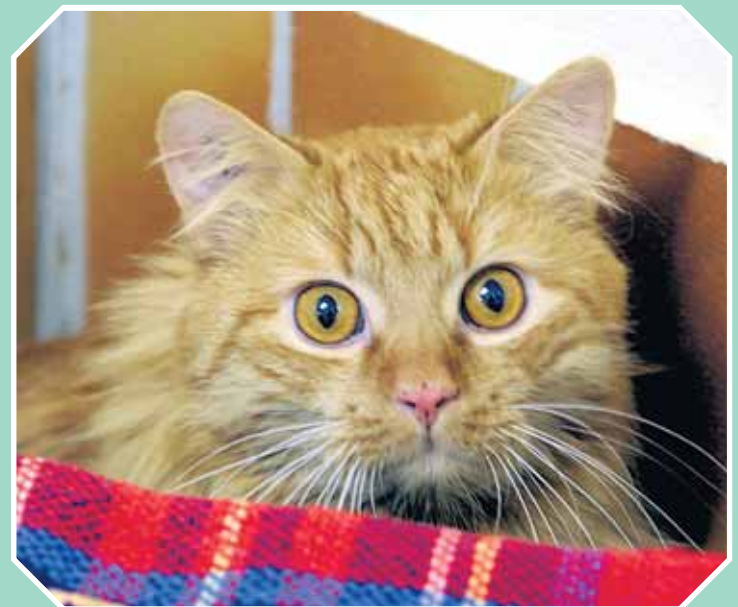
Die wollen mich heute nicht wirklich impfen?!