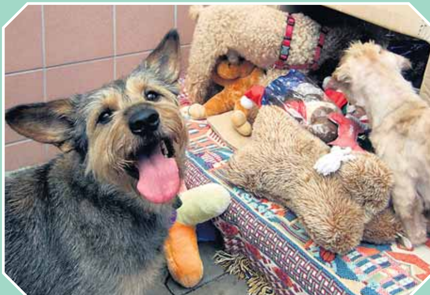
Das Paket ist ganz allein für uns!