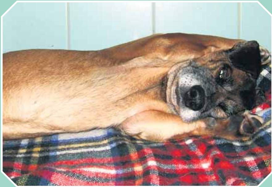
Warum können die mich nicht endlich mal ausschlafen lassen?