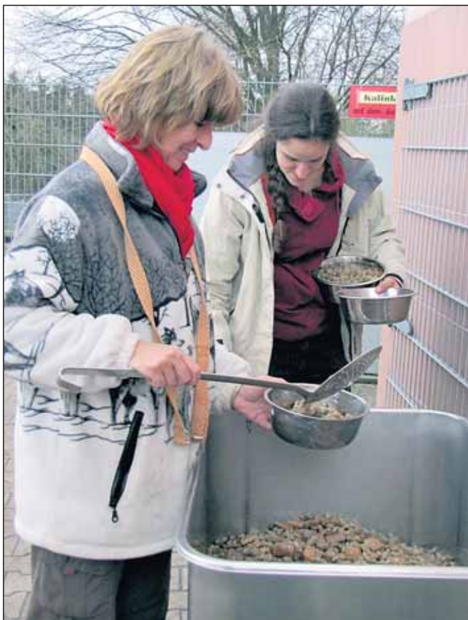
„Mit meiner Kollegin beim Füttern.“

Nach einer kurzen Kaffeepause kommt der Teil des Tages, den sicherlich jeder am wenigsten mag: Das Reinigen der Hundehäuser.