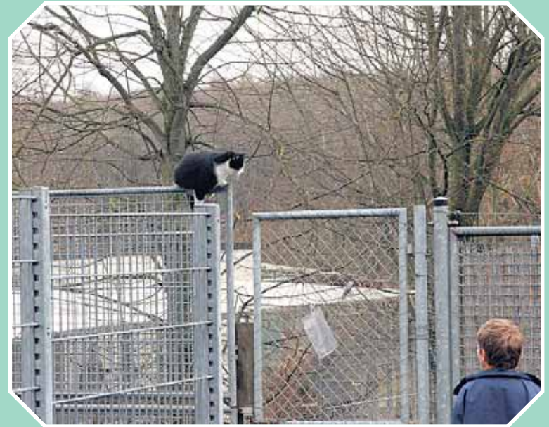
Drahtseilnummer zum Frühlingsfest? Auf was hab ich mich nur eingelassen.