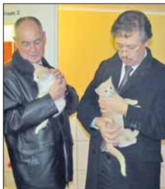
Rudolf Köberle und Dieter Hillebrand beim Streicheln der Samtpfoten

Belange der Tierheime und des Tierschutzes zu informieren. Bei der Besichtigung der Räumlichkeiten wurde auch auf die Problematiken hingewiesen, dass Tierheime immer mehr mit exotischen Tieren zu tun haben, da die Besitzer sich diese Tiere aus Unwissenheit oder falscher Beratung angeschafft haben. Bei der Erläuterung, dass die Reutlinger Hundehäuser dringend saniert werden müssen, wiesen die Besucher darauf hin, dass das Land für 2010 und 2011 ein Programm aufgelegt hat, das Zuschüsse zu dringenden Sanierungen und Renovierungen in Tierheimen gewährt. Voraussetzung dabei ist eine Beteiligung der jeweiligen Kommunen mit dem gleichen Betrag. Minister Köberle sprach davon, dass Themen wie finanzielle Bewältigung in Tierheimen und deren Entwicklung weiterhin eine Daueraufgabe im Landtag sein werden.