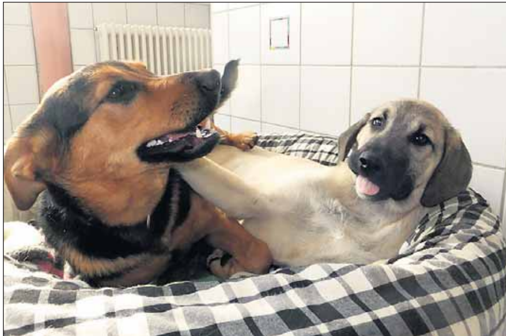
„Zwei die sich sichtlich wohl fühlen.“

In den folgenden Tierschutz-Ausgaben wollen wir Ihnen die verschiedenen Bereiche näher bringen, damit sich der eine oder andere Tierschützer die Frage überlegen kann, in welchem Bereich er gerne aktiv mitarbeiten möchte. Beginnen werden wir in dieser Ausgabe mit der Hundeabteilung und dem damit verbundenen ehrenamtlichen Sonntagsdienst.