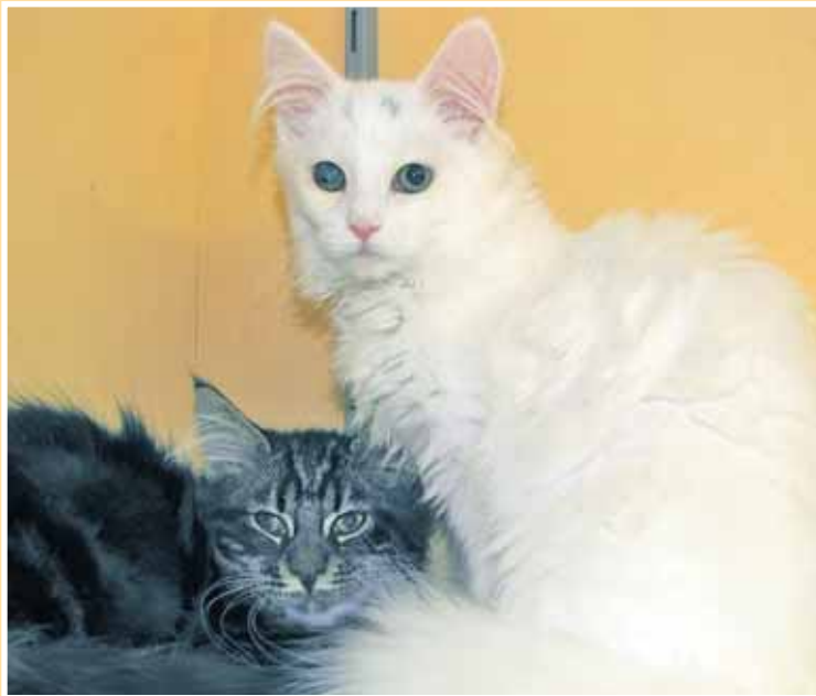
Bonnie und Bastian

Ihr bisheriges Leben verbrachte die inzwischen achtjährige Katze bei einer älteren Frau. Diese hat sich schweren Herzens von ihr getrennt, weil sie befürchtete, sich bald nicht mehr um ihre geliebte Mausikümmern zu können. Da auch Mausikü die Trennung sehr schwer gefallen ist, versucht sie im Tierheim alles, um bald wieder ein neues Zuhause zu finden. Mausikü ist sehr pflegeleicht und liebt Hunde und Katzen.