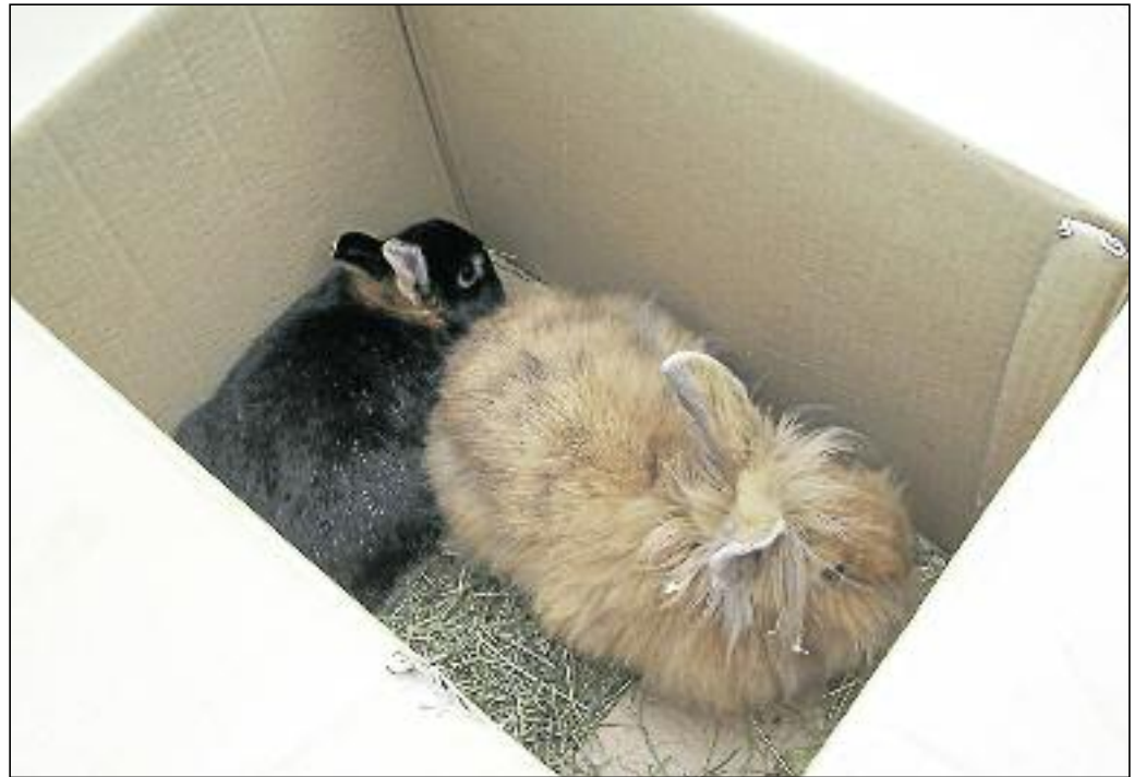
Immer wieder kommt es vor, dass die Tiere einfach ausgesetzt werden. Nicht alle haben das Glück, dass man sie rechtzeitig entdeckt

Können Sie nun verstehen, warum Tierschützer ein Problem damit haben, dass Kaninchen und andere Kleintiere quasi im Vorbeigehen in Baumärkten und Tierfutter- und zugehörigen Geschäften verkauft wer-