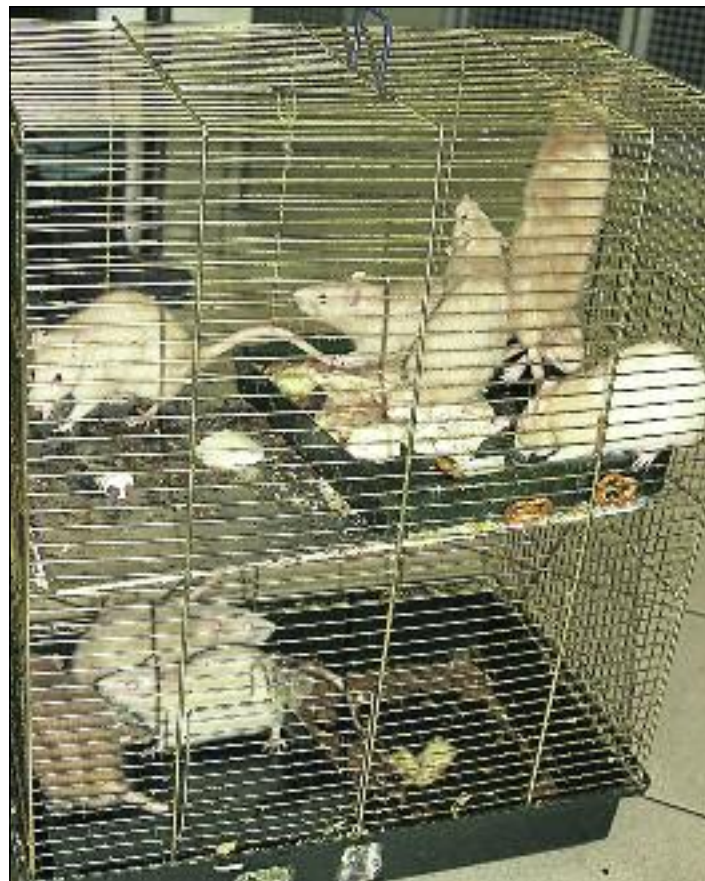
In diesem völlig verreckten Käfig mussten die elf Ratten mehrere Wochen ausharren

Inzwischen haben die 6 Männchen und 4 Weibchen eine geräumige Voliere im Tierheim gefunden, in der sie buddeln, spielen, als auch graben können. Die männlichen Tiere werden alle kastriert und unsere fachkundigen Pfleger vermitteln dann in artgerechte Haltung.