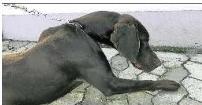
Bei Kettenwürgern wird der Kehlkopf und die Halswirbelsäule in Mitleidenschaft gezogen