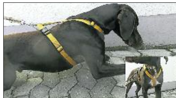
So ist es richtig. Der Druck bei einem Geschirr wird auf eine größere Körperfläche verteilt