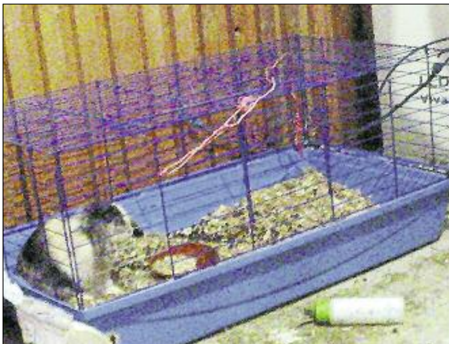
Völlig isoliert in einem Käfig saß dieses Kaninchen mehrere Wochen lang im Keller

Zwei Mitarbeiterinnen des Tierschutzvereins überprüften die Meldung. Die Besitzer des Kaninchens waren nicht zuhause, aber die Anruferin zeigte den Mitarbeitern des Tierheims das Tier im Keller.