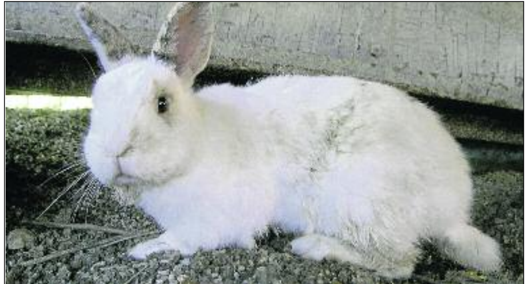
Vernachlässigtes Kaninchen, stumpfes und verdrecktes Fell. War bei der Abgabe sehr mager

Die Käfige im Handel entsprechen bei weitem nicht den Bedürfnissen der Tiere. Auch die Ausläufe, die man im Sommer in vielen Gärten sieht, lassen an Größe zu wünschen übrig. Oftmals nur 1x1 m oder 1,50 x 1,50m, im schlimmsten Fall ohne Schutzhütte und Möglichkeit zu buddeln. Die Tiere werden morgens und abends zum engen