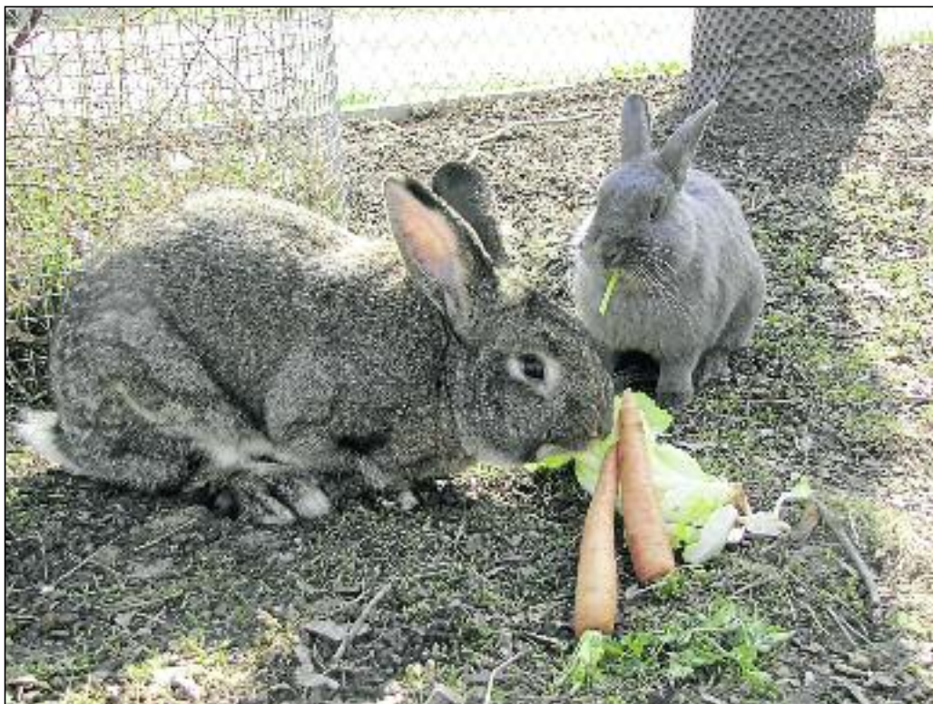
Bei guter Pflege und der richtigen Ernährung können Kaninchen 8 bis 10 Jahre alt werden

Bitte bedenken Sie: Auch alle anderen Kleinnager sind anspruchsvoll!