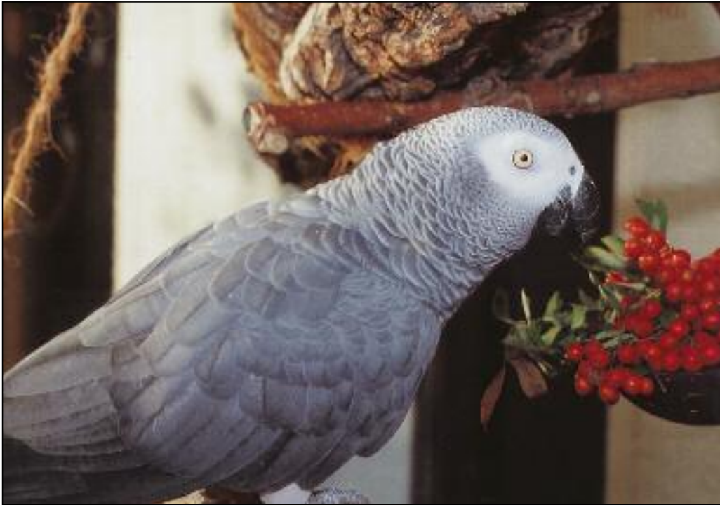
Eine abwechslungsreiche Ernährung gehört auf den Speiseplan der Tiere