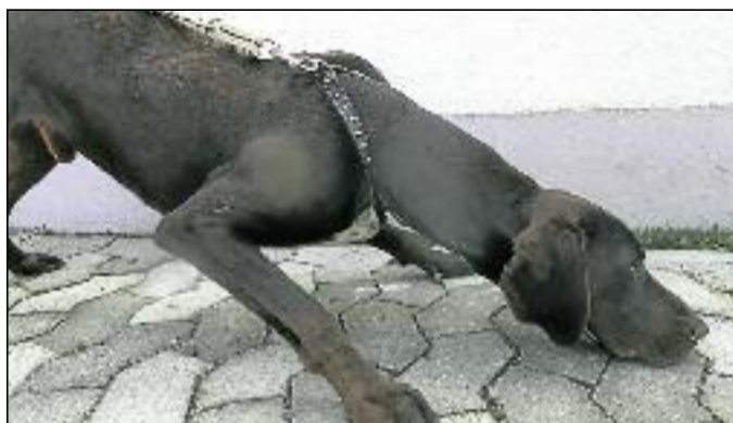
Ein zu dünnes Halsband schneidet sich tief in den Hals

Mit der Zeit werden Begegnungen mit Hunden an der Leine also immer schlimmer. Zu diesen sozialen Aspekten kommen auch noch weitere gesundheitliche Folgen dazu: Rückenerkrankungen, Halswirbelerkrankungen, Band-