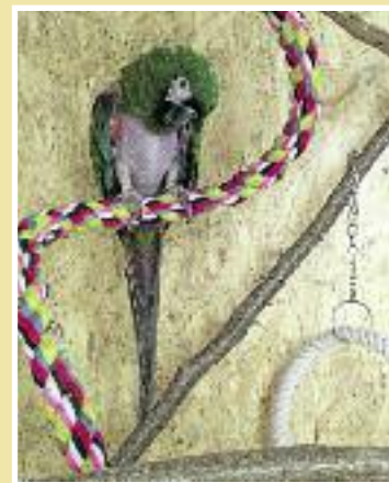
Kiki klettert am liebsten auf Seilen im neuen Zuhause

Kiki ihr neues zu Hause bezogen. In einer großen Voliere und mit täglichem Freiflug haben die beiden nun alles, was Sie für ein zufriedenes Papageienleben brauchen.