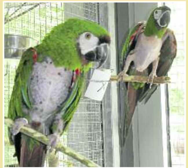
Kiki und Coco nach Ihrer Vergesellschaftung im Tierheim

Der Anblick der beiden Rotbugaras erinnert eher an gerupfte Hühner als an farbenprächige Amazonen. Beide zeigten extreme Verhaltensstörungen. Coco ist 17 Jahre alt und war von klein auf nur auf den Menschen geprägt. Kontakt zu anderen Tieren gab es nicht. Als seine Besitzer ihn nicht mehr halten konnten, gaben sie ihn an Bekannte weiter. Dort fing er bereits an sich die Federn auszurupfen. Dem neuen Besitzer fehlte aber auch die Zeit für ihn, so dass er den ganzen Tag alleine war. Das Rupfen wurde immer schlimmer und Coco immer verhaltensauffälliger. Schließlich gaben sie ihn im Tierheim ab.