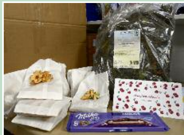
Selbst für die Pfleger war etwas dabei