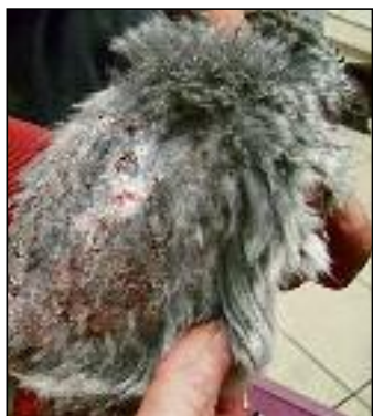
Viele der Tiere waren bei der Abgabe in einem sehr schlechten gesundheitlichen Zustand

Die Aufnahme der großen Anzahl an Chinchillas stellte die Pflegerinnen und Pfleger vom Kleintierhaus vor eine große Herausforderung. Der Pflegeaufwand für die Tiere war enorm. Alle hatten sehr schlechtes Fell, wunde Läufe, Zahnprobleme, waren unterernährt und apathisch. Da die Tiere nicht nach Geschlechtern getrennt waren, hatten die Männchen wegen den anwesenden geschlechtsreifen Weibchen gekämpft. Bissverletzungen am Rücken und an den Ohren waren die Folge. Durch die vielen Verletzungen waren die Tiere lange nicht in einem OP-fähigen Zustand und konnten auch nicht gleich kastriert werden. Bei den tragenden Weibchen muss natürlich die Geburt abgewartet werden.