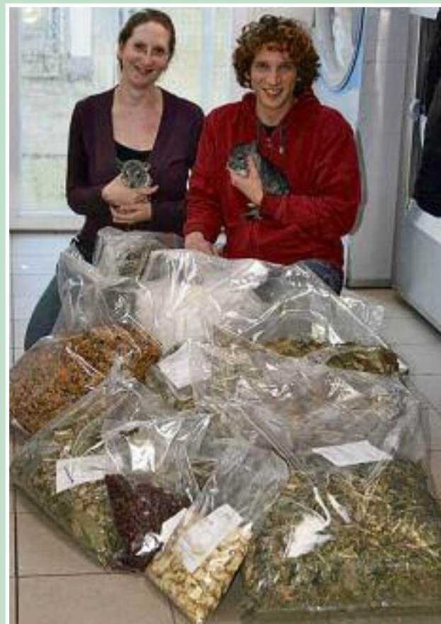
Liebevoll zusammengestellte Pakete erreichten uns

Vielen lieben Dank für diese tolle Unterstützung!