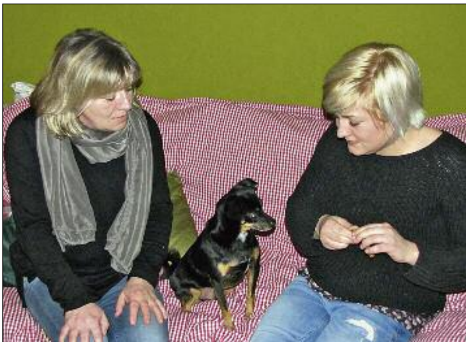
Seine neue Familie hat Peanut fest in ihr Herz geschlossen

schlossen sie jedoch Peanut in ihr Herz und auch die Hündin der Familie fand immer mehr Gefallen an dem Pinscherrüden.