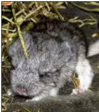
Ein Chinchillajunges kam im Tierheim gesund zur Welt

Am 18.03. brachte ein Muttertier im Kleintierhaus ein gesundes Junges zur Welt. Die anderen tragenden Weibchen werden gut gehütet und versorgt, bis