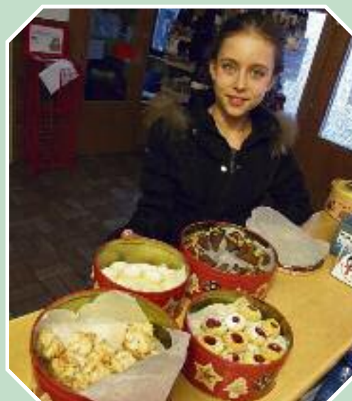
Sie hat für uns leckere Weihnachtsplätzchen gebacken. Der Erlös ging ans Tierheim