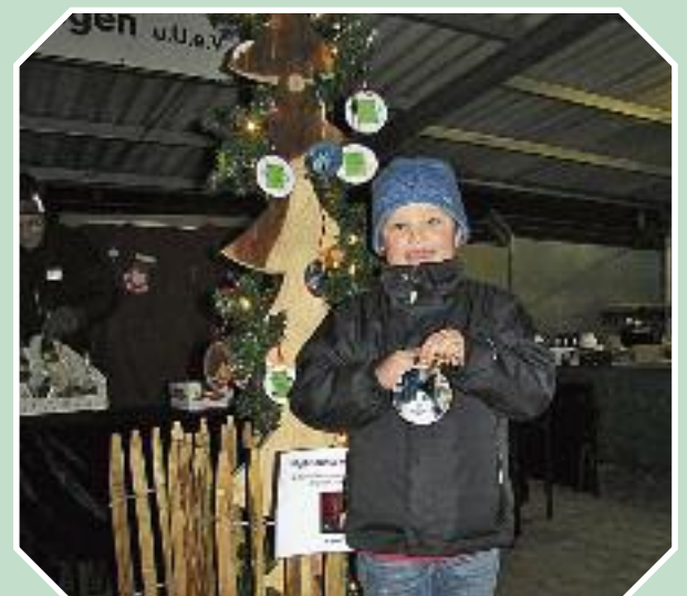
Weihnachtungswünsche für unsere Tiere - ein 6-jähriger Junge hat mit seinem Taschengeld Tierheimkater Emil ein neues Körbchen spendiert