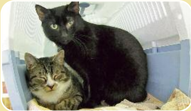
Randy und Jake

Die beiden Kater haben im Tierheim eine echte Männerfreundschaft entwickelt. Die Pflegerinnen, die ihnen täglich ihr Futter bringen, sind zwar willkommen, dennoch genießen die beiden ihre Zeit zu zweit. Ist auch viel angenehmer, denn vor den Menschen haben sie noch etwas Scheu. Der schwarze Kater Jake hat aber schon mehr Vertrauen gefasst und lässt sich hin und wieder gerne kraulen. Mit seinen drei Jahren hat er auch noch genügend Zeit, Vertrauen zu fassen. Randy ist sechs Jahre alt und braucht manchmal etwas länger, bis auch er sein Körbchen verlässt und sich zum Streicheln anbietet.