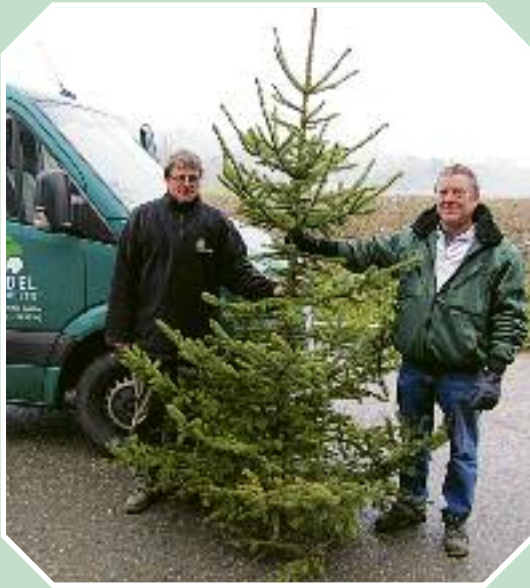
Gärtnerei Handel spendierte uns einen Tannenbaum für unseren Weihnachtsmarkt