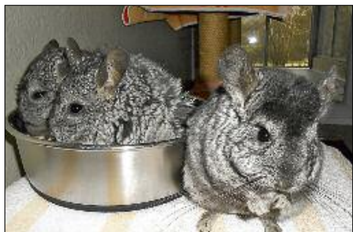
Die Aufnahme von 17 Chinchillas stellte das Tierheim vor große Herausforderungen

Natürlich freuen wir uns auch weiterhin über finanzielle Unterstützung oder Sachspenden (Spezialfutter, Einrichtungsgegenstände...)