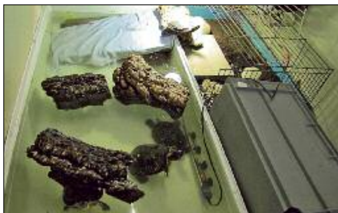
In diesen Provisorien sind die Wasserschildkröten im Tierheim Reutlingen momentan untergebracht