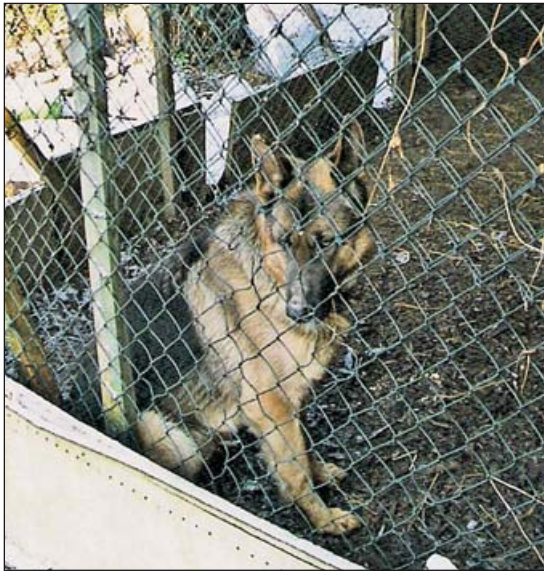
In einem dreckigen Zwinger, der gegen die Kälte völlig ungenügend isoliert war, lebte dieser Schäferhund

Sie sind da, wo die Not am größten ist. Sie versuchen zu helfen, zu vermitteln und oftmals mit Hilfe der Behörden Tiere aus katastrophaler Haltung zu befreien – die Tierschutzberaterinnen des Reutlinger Tierheims.