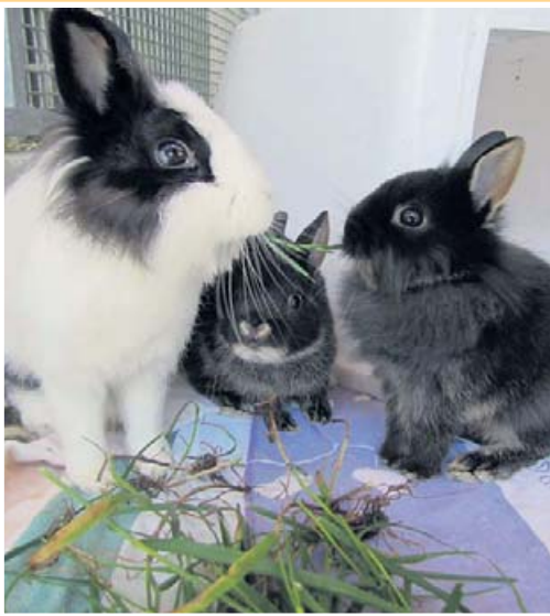
Nach ihrer Rettung mussten sich die verstörten Tiere erst einmal stärken