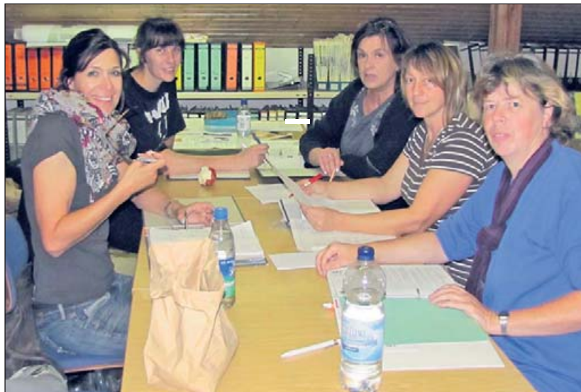
Die Tierschutzberaterinnen bei der Manöverbesprechung

Wir danken gleichzeitig all den Menschen, die tierwidrigen Umgang mit Tieren oder solche Haltungen melden. Ebenso sind wir natürlich dankbar für alle Spenden, durch die z. B. die Unterbringung, medizinische Versorgung, Zuwendung und Resozialisierung solcher gequälter Tiere im Tierheim ermöglichen. Sie können sich davon überzeugen, dass ihre Spenden in ihrem Sinne verwendet werden – kommen Sie während unserer Öffnungszeiten ins Tierheim oder zu unseren Veranstaltungen oder als Mitglied im Tierschutzverein Reutlingen zu den Mitgliederversammlungen.