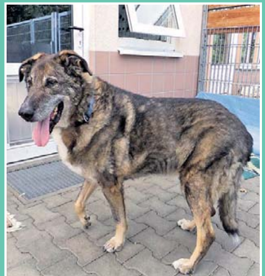
„Manolo“ hatte keine Chance – er musste eingeschläfert werden.