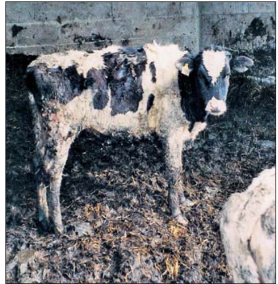
Meterhoch im eigenen Dreck fristete diese Kuh ihr Dasein

Einen Lieblings-Tierschutzfall zählt dabei zu den wenigen Aktionen, an die sie gerne zurückdenken. Darin ging es um eine Meldung,