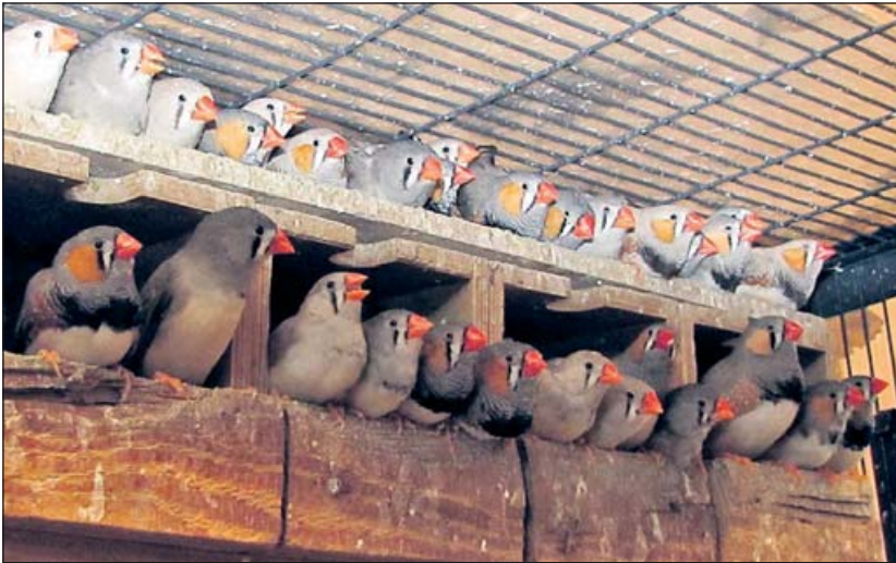
„50 Zebrafinken in ihrem stark verdreckten und verkoteten Käfig“

Mit Tierliebe hatte diese Haltung wahrlich nichts mehr zu tun. Weil der Besitzer von 50 Zebrafinken in eine neue Wohnung ziehen musste, kamen die Tiere ins Tierheim. Sie waren in einer Voliere von gerade mal 1,5 qm 2 untergebracht. Viel zu eng für so viele Tiere. Die hygienischen Zustände ließen ebenfalls sehr zu wünschen übrig. Der ganze Käfig war verdreckt und verkotet, an