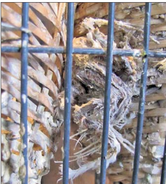
„ein verwester Zebrafink zwischen den Brutkörben belegt die schreckliche Haltung der Tiere“

Leider gibt es solche Fälle von schlechter Haltung immer wieder. Viele Besitzer sind sich des oftmals schlechten Zustands ihrer Tiere und der nicht artgerechten Unterbringung nicht bewusst bzw. nehmen dies nicht (mehr) wahr. So leiden und vegetieren täglich Tausende von Tieren in verwahter und tierwidriger Haltung, ehe sie – jedoch leider nur selten – durch Zufälle wie den obigen gerettet werden können.