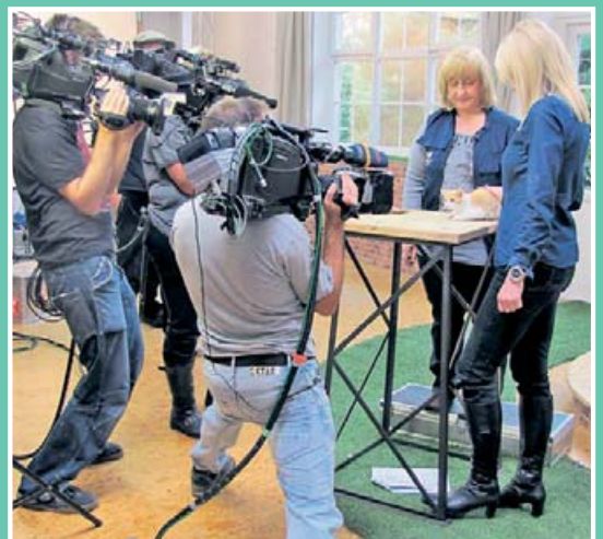
„Keine Scheu zeigte Kätzchen Xenia vor den vielen Kameras“